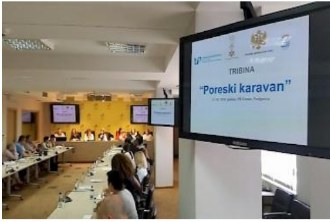
Sa tribune "Poreski karavan" u Podgorici