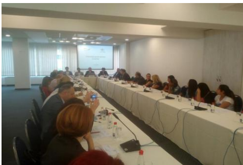
Sa seminara Gradanske alijanse

Na poziv Građanske alijanse (GA), predstavnica UPCG je u okviru dvodnevnog stručnog skupa “Unapređenje zapošljavanja Roma u Crnoj Gori” održala izlaganje na temu “Specifičnosti tržišta rada”. Seminar održan 30. i 31. maja u Podgorici, u organizaciji GA i uz podršku ambasade Savezne Republike Njemačke u Crnoj Gori, otvorili su ministar za ljudska i manjinska prava, razvojna direktorica GA i predsjednik NVO Phiren Amenca. Uz radni dio, u nastavku je upriličeno svečano uručjenje diploma polaznicima radionica koje je realizovala GA, te predstavljen dokumentarni film “Rom: Neke sretne priče” režisera Nikole Vukčevića.