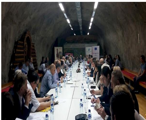
Godišnja sjednica Skupštine UPCG

U nastavku rada, učesnicima skupa predstavljen je sadržaj novog dokumenta Unije poslodavaca „Smjernice o dobrom upravljanju“ koji je UPCG kreirala u saradnji sa Međunarodnom organizacijom rada.