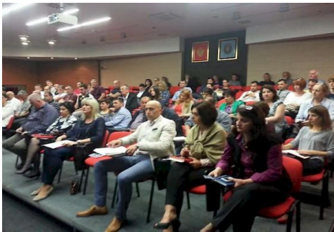
Sastanak sa privrednicima koji posluju u opštini Tivat